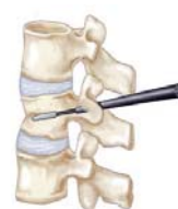
Εικόνα 2β Εισαγωγή μπαλονιού στο σπονδυλικό σώμα