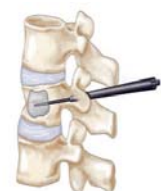
Εικόνα 2γ Ανάταξη κατάγματος με την έκπτυξη του μπαλονιού