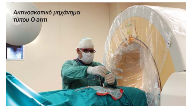
Ακτινοσκοπικό μηχάνημα τύπου O-arm

Η όλη επέμβαση διαρκεί περίπου 15 λεπτά για κάθε σπόνδυλο. Ο πόνος του κατάγματος υποχωρεί αμεσα. Ο ασθενής μετά την επέμβαση παραμένει για λίγο υπό παρακολούθηση στο χώρο ανάνηψης. Κινητοποιείται πλήρως και στο νοσοκομείο παραμένει από λίγες ώρες ως 1 ημέρα. Στο σπίτι μπορεί να επανέλθει στις συνήθεις δραστηριότητες του άμεσα χωρίς να χρειάζεται παραμονή στο κρεβάτι ή εφαρμογή ζωνών και κηδεμόνων της μέσης. Ωστόσο ενέργειες που απαιτούν αυξημένη προσπάθεια π.χ. σήκωμα μεγάλου βάρους, πρέπει να αποφεύγονται για τουλάχιστον έξι εβδομάδες.