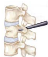
Εικόνα 2α Εισαγωγή βελόνας στο κάταγμα

Στην Κυφοπλαστική, (εικόνα 2α ,2β ,2γ, 2δ) ο ιατρός χρησιμοποιεί ακτινοσκοπική καθοδήγηση, για να εισάγει διαμέσου βελόνας ένα μπαλόνι στο σπονδυλικό κάταγμα, το οποίο εκτεινόμενο ανατάσσει το κάταγμα και δημιουργεί μια κοιλότητα μέσα στον Σπόνδυλο. Η ενίσχυση των σπονδύλων που έχουν υποστεί κάταγμα γίνεται με έγχυση ειδικού σκληρυντικού υλικού στην κοιλότητα όταν το μπαλόνι απομακρυνθεί. Η χειρουργική τομή είναι περίπου 1 χιλιοστό.